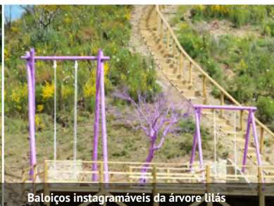
Baloços instagramáveis da árvore lilás