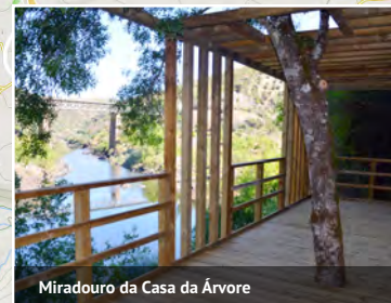
Miradouro da Casa da Árvore