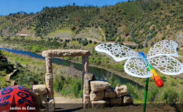
Jardim do Éden