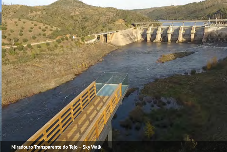
Miradouro Transparente do Tejo - Sky Walk